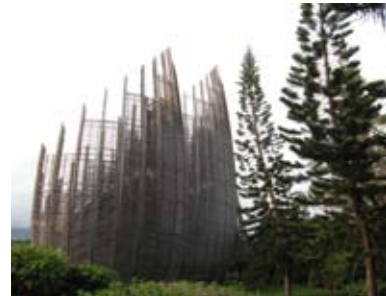
De top van het huis met de stijlen die tot buiten de topgevel doorlopen, verwijst naar een werk van Renzo Piano (1937). Het is het Jean-Marie Tjibaou Cultureel Centrum (1998) in Nouméa, Polynesië, een centrum waarin de Kanak-cultuur van het Pacificische Nieuw-Caledonië uitgedragen wordt.