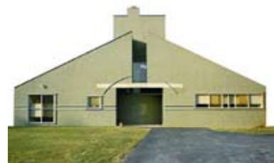
Een traditioneel Zaanse pakhuis. De topgevel is geïnspireerd op het werk van Robert Venturi (1925).